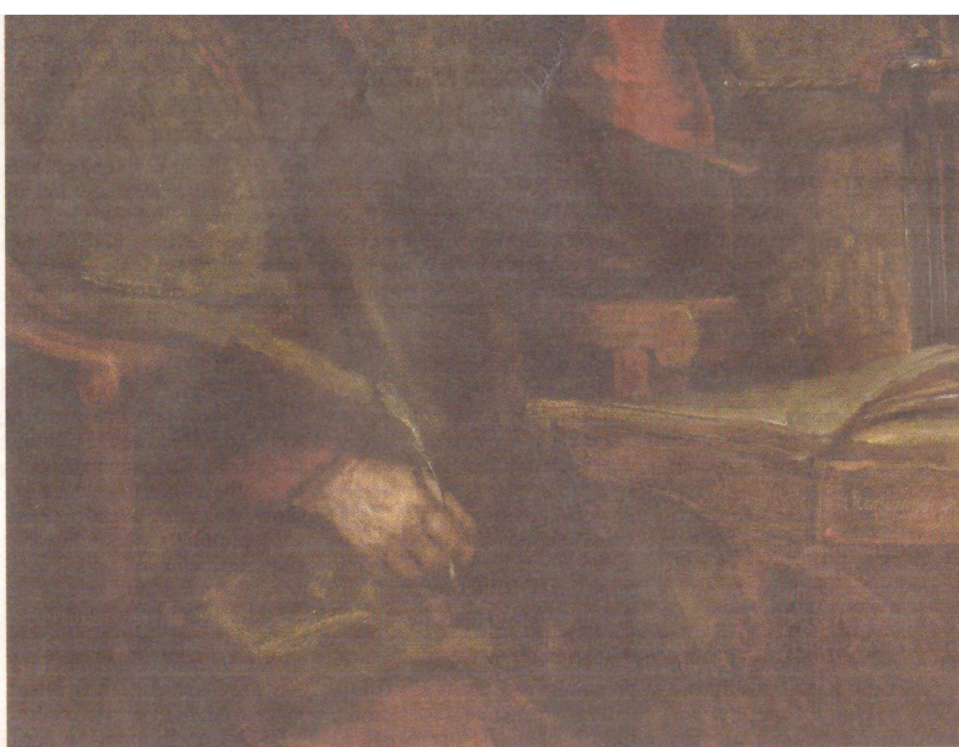
Rembrandt van Rijn: Apoštol Pavel (1657)

Třeba v jeruzalémském chrámu měli pohané povolen přístup na vnější nádvoří – další nádvoří bylo rezervováno pro židovské ženy, další pro židovské muže, k oltářům pak mohli jen kněží.