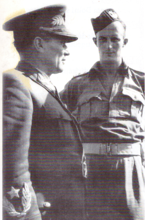
« Maclean s Titem kolem roku 1943

Macleanovi se nakonec podařilo získat pozvání k oficiální návštěvě Záhídhího vily. Přijel tarozemem, vešel dovnitř a byl uveden do parádního salonu. To, co následovalo, popsal Maclean ve svých pamětech: „Když o pár minut později do místnosti vešel generál Záhídhí, elegantní muž v padnoucí šedé uniformě a vyleštěných botách, zjistil, že hledí do hlavně mé automatické pistole Colt.“ Rukojmí pak Fitzroy bez jakéhokoliv odporu odvezl přímo na letiště, kde ho posadil na letadlo do Londýna. Díky jednoduchosti, s jakou zadaný úkol splnil, mu získala určitý věhlas a s ním i další bojové úkoly, kterým nakonec přivedly zpět do válečné Evropy.